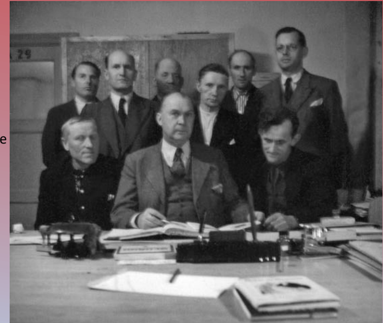
Svenskar och normän överlägger i Hattfjälldal om Sagavägen. 1944