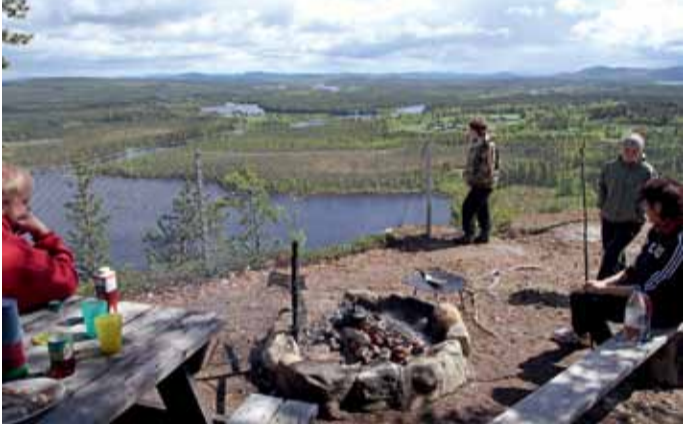
Borgvattenberget - der so genannte Osterstein.

Åsele Vintermarknad Ende März bietet über die Marktstände hinaus noch Handwerksmesse, Hundeausstellungen und Åsele-Nappet, einen der größten Wettkämpfe Schwedens im Eisfischen. Auf dem Åslia, direkt bei Åsele, ist Abfahrtslauf möglich, und am Orstrand gibt es Langlaufloipen. Für Schlittenhundfreunde gibt es im Ort Gafsele eine Schlittenhundestation mit Trainings- und Wettkampfstrecke, wo auch schon Weltmeisterschaften ausgetragen wurden.