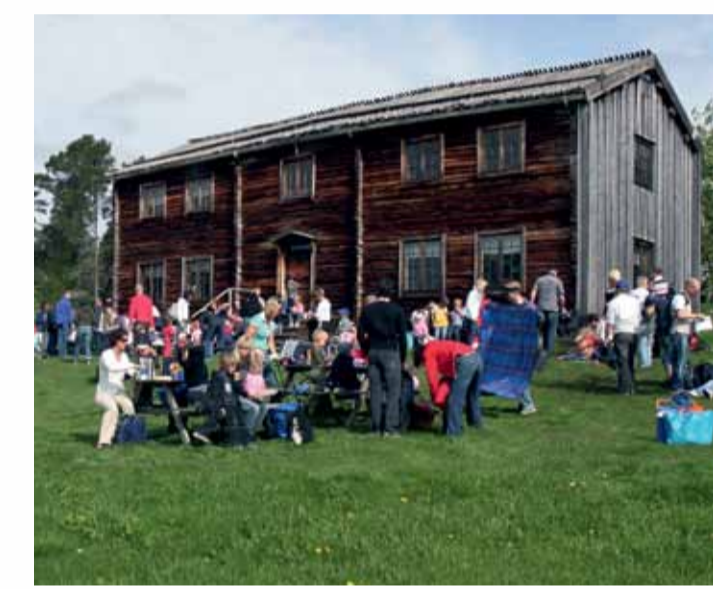
Myckelgensjö, Örnsköldsvik.

Wenn Sie auf der Märchenstraße Sagavägen unterwegs sind, passen Sie auf, denn die Landschaft ist nicht nur von Menschen bewohnt. Hier leben auch Vittra, Stafotok, Riesen und andere Wesen, die Sie sehen können, wenn Sie genau hinschauen. Die Märchenstraße Sagavägen nimmt Sie mit auf eine spannende Reise durch die Welt von Märchen, Geschichten und Sagen. Die Erzählungen handeln von Riesen und Trolen, Elfen und Seeungeheuern, wie sie im schwedischen, norwegischen und samischen Volksglauben zu Hause sind..