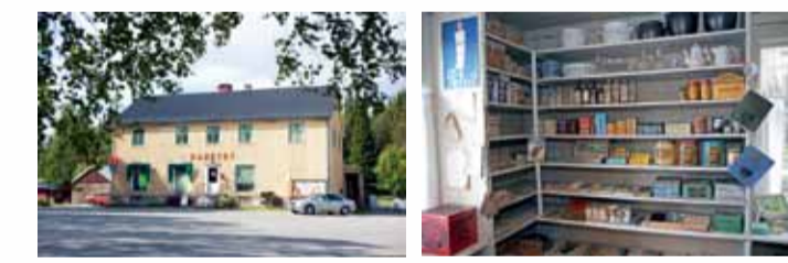
Hamnreby in Dikanäs und Asplunda lanthandel in Tallsjö.

Die kontrastreiche Landschaft und die interessante Kultur bieten unvergleichliche Erlebnisse. Sagavägen bedeutet Märchenstraße. Den Namen verdankt diese Querbindung zwischen Schweden und Norwegen eigentlich dem reichen Geschichten- und Sagenschatz Helgelands. Doch in Wirklichkeit ist der gesamte Sagavägen wie eine abenteuerliche Geschichte, voller Spannung Abwechslung und Romantik. Die Märchenstraße hat wirklich alles, was zu einer guten Geschichte gehört: Der Anfang macht neugierig, die Spannung wird gehalten, und das Ende geht immer gut aus, ganz gleich, aus welcher Richtung Sie kommen.