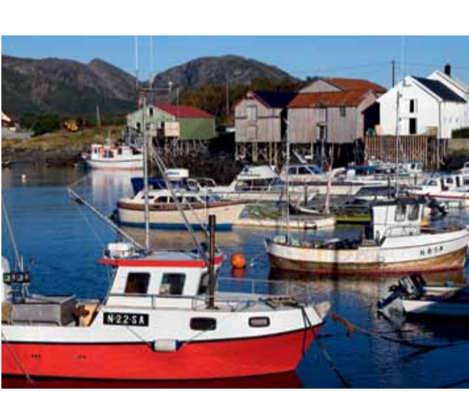
Viksjøens Bootsanleger in Sømna.