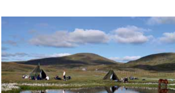
Mäsvatnet von Nordlandsruta.

Das Naturreservat Ögeltjärn liegt im Erholungsgebiet Gullvik. Von Gullviks havsbad och camping aus führen Wege in die Umgebung zu Schutzhütten, Grillplätzen, Aussichtsbergen u. v. m. Wenn Sie