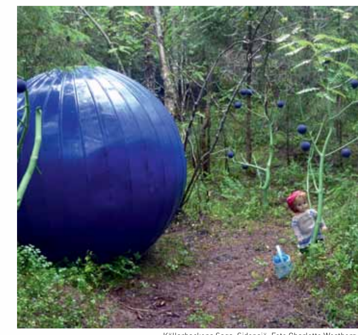
Källarbackens Saga, Sidensjö.