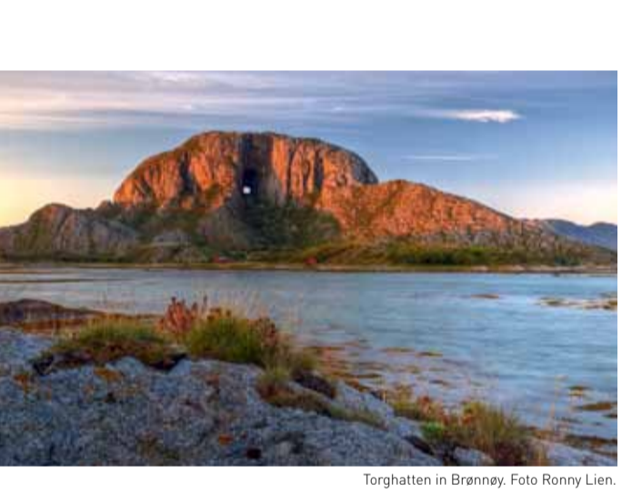
Torghatten in Brønnøy.

Sagavägen folgt zweien unserer alten Wasserwege, Ångermanälven und Vojmäån. Auf Ihrer Reise passieren Sie Orte wie Meselefors, Rönнас, Stalon und Grånsjöarna. Jeder davon hat seine eigene interessante Geschichte. Dikanäs ist hier die kleine Metropole mit