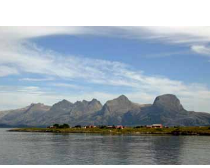
De syv søstre in Alstahaug.

Nicht nur Natur und Kultur sind interessant, hier gibt es auch Norrlands größtes Volksfest, Åsele Marknad und eine Menge mehr. Mitten im Ortszentrum liegt Åsele Hembygdsområde, eine entspannte Oase , die viel Wissen birgt, u. a. eine der mit Abstand bedeutendsten Textilsammlungen der ganzen Provinz mit Accessoires. Jährlich am dritten Wochenende im Juli ist Åsele völlig verwandelt. Dann kommen rund 150 000 Besucher für vier intensive Markttagge zum Åsele Marknad, der sich zum größten Volksfest in Norrland entwickelt hat. In der Kommune liegen auch Björnlandet, der einzige Nationalpark Västerbottens, und Stockholmsgata, ein imposanter Canyon aus der Eiszelt. Wer gern angelt, findet hier viele ausgezeichnete Fischgewässer.