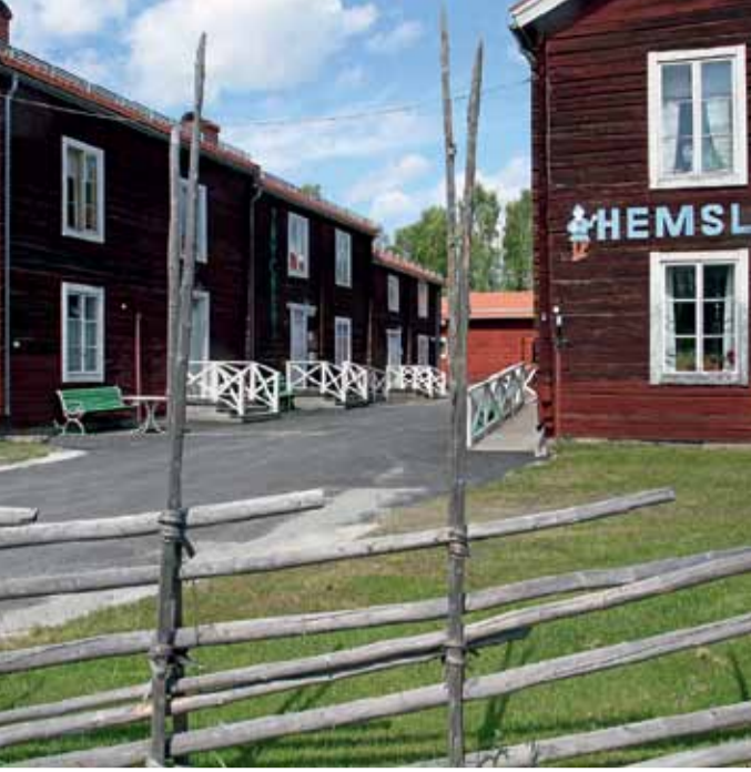
Heimatmuseum in Åsele.

Mosjøen liegt in Vefsn kommun und ist Helgelands älteste Stadt und die zweitälteste in ganz Nordland. Mosjøen ist eine Kultur- und Musikstadt, die im Laufe des Jahres unzählige Konzerte und Vorstellungen bietet. Sjøgataområdet, ein Viertel im Zentrum von Mosjøen ist ein Beispiel für Geschichte, die lebt. Die alten Häuser aus dem 19. Jh. sind immer noch Teil des städtischen Lebens und verleihen dem Ort Farbe. Auf Ihrem Streifzug durch das Viertel finden Sie viele architektonische Kleinode und interessante Gebäude – ein schützenswertes Kulturerbe. Mosjøen bietet ein großes Freizeitangebot. Besuchen Sie das neue Bad auf Kippermon, laufen Sie bis Marsøra und sehen Sie sich Sjøgata von der Meerseite aus an oder gehen Sie hinauf nach Mosåsen, das ganz nahe liegt und bequem erreichbar ist. Wenn Sie etwas weiter laufen wollen, können Sie eine Tour auf das Øyfjell unternehmen. Statt Ekippasjen bietet Reittouren an, und auf Mosjøen Camping können sie bowlen. Im Laufe des Jahres finden viele große Veranstaltungen statt, unter anderem Galleria Kunstfestival, Kippermoccupen, die festlichen Hanedagarna und der historische Markt Tiendebytte, um nur einige zu nennen. ♦