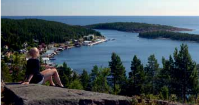
Blick über Ulvöhamn, Foto: Malin Wedin.

Die Insel Ulvön liegt in den Schären von Örnsköldsvik, im Herzen der Hohen Küste. Eigentlich sind es zwei Inseln – Norra und Södra Ulvön. Ulvöhamn liegt auf der nördlichen Insel, gut geschützt im Ulvösund. Ulvön ist wohl am bekanntesten für den Surströmming, die angeorene Heringspezialität, die hier seit mehr als hundert Jahren hergestellt wird. In der schönen Schärenatmosphäre gibt