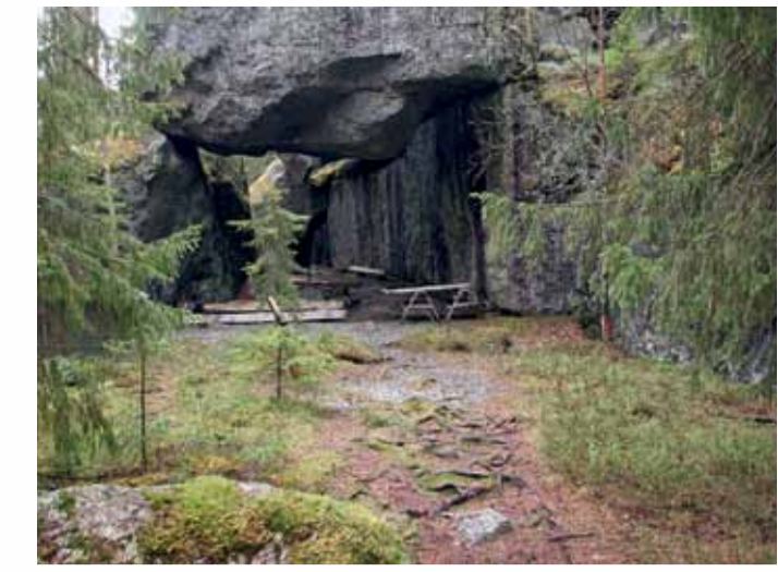
Die Felsformation Vitterhuset.