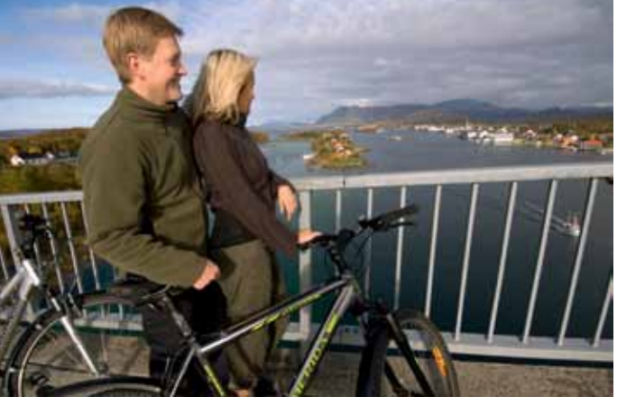
Blick von Brønnøyruva.

vollem Sommerprogramm! Sie können selbst Tunnbröd (Fladenbrot) backen, an einer geführten Wanderung teilnehmen oder eine Kåsa schnitzen, das traditionelle Schöpf- und Trinkgefäß. In Dikanäs gibt es ein Motorradmuseum mit dem ersten Moped von Ingemar Stenmark über Veteranen-Motorräder bis zur Harley Davidson. Das Museum in Henriksfjäll ist eine Goldgrube für alle, die Storytelling lieben. Bei vielen Ausstellungsobjekten besteht die Möglichkeit, den Erzählungen älterer Menschen über ihren Alltag vor nicht allzu langer Zeit zu lauschen. Ein Muss auf Ihrer Reise auf dem Sagavägen ist ein Abstecher nach Fatmomakke. An dem alten samische Kirchplatz mit Ursprüngen im 17. Jahrhundert stehen noch über 80 Koten und mehr als 20 Siedlerheime.