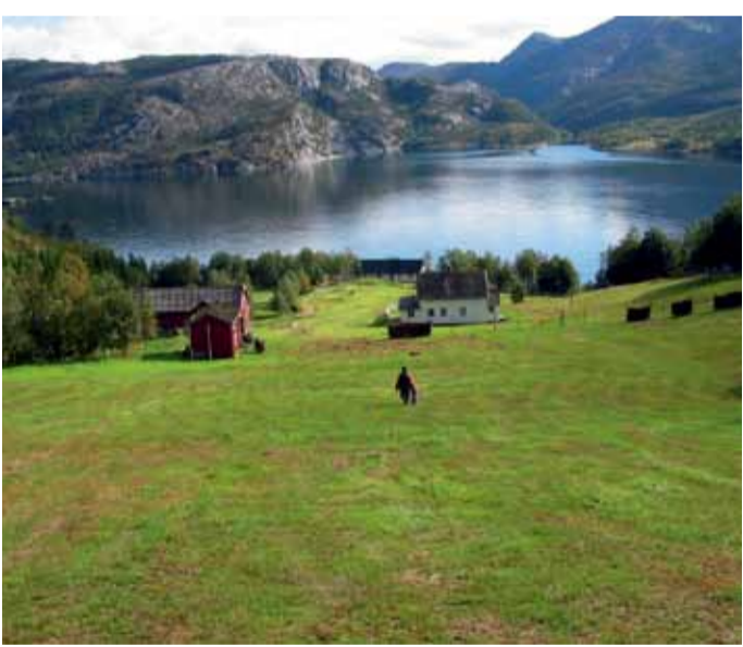
Benå Villmarkssenter.

Die Inselkommune Dønna ist schon seit der Völkerwanderungszeit bis ins frühe 20. Jh. ein bedeutendes Macht- und Kulturzentrum in Helgeland gewesen . Die Insel hat also eine reiche und stolze Geschichte, die Natur ist großartig und fruchtbar, die Tierwelt artenreich, u. a. mit einer einzigartigen Vogelfauna. Breivika ist der schönste Badestrand Dønnas und ein idyllisches Ausflugsziel. Von hier aus können Sie auch Ihre Wanderung auf den Gipfel des Dønnamannen starten, eine beliebte Tour für Wanderer, die eine kleine Herausforderung suchen. Øya Løkta liegt auf der Nord-ostseite von Dønna und ist das perfekte Ziel für Radtouren. Nach Dønna kommen Sie mit der Fähre von Sandnessjøen oder über die Äkviksundsbrücke, die Herøy und Dønna verbindet. ♦