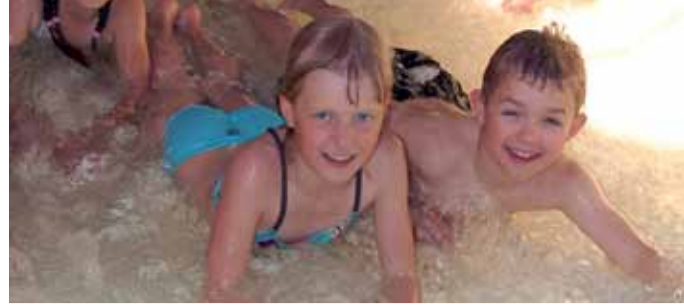
Paradiesbadet in Örnsköldsvik.

Helgeland Reiseliv ist das Tourismusunternehmen, zu dem sich 18 Kommunen in Helgeland in Nordland fylke, Norwegen, zusammen geschlossen haben. Hier stellen wir einige ausgewählte Angebote am Sagavägen vor. Auf unserer Website, www.visithelgeland.com, gibt es Informationen über Radtouren, Wanderwege, Wasserwege sowie Wohn- und Essmöglichkeiten. Hier finden Sie auch Reisearrangements und andere wertvolle Informationen für alle, die auf Helgeland schon ganz neugierig sind. Willkommen!