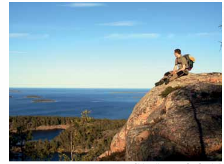
Blick von Høga Kusten.