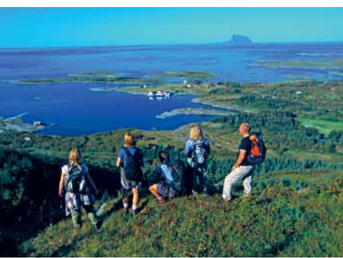
Blick von Dannmannen.

In Sandnessjøen finden jährlich mehrere interessante und unterhaltsame Veranstaltungen statt, u. a. die Petter Dass-Tage, die Bootmesse und die WM im Krabbenfischen. ♦