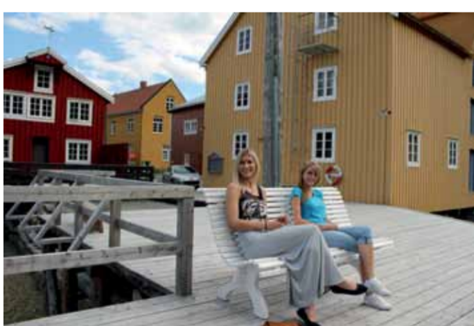
Sommarglädje i Mosjøen.

Grane är platsen med de stora naturupplevelserna. Mäktiga Børgefjell nationalpark ligger på ena sidan och Lomsdal-Visten nationalpark ligger på den andra. Den kända laxälven Vefсна rinner också genom kommunen. I både Børgefjellet och Loms-dal-Visten finns många fina fiskevatten och vandringsområden. E6 och Nordlandsbanan går genom Grane kommun och det finns vägförbindelser till Sverige och till kusten via Tosenveien (FV76). Närmaste flygplats ligger i Mosjøen, 42 km bort. ♦