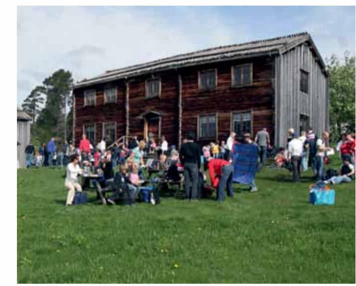
Kvitelsgjø, Örnsköldsviks kommun.