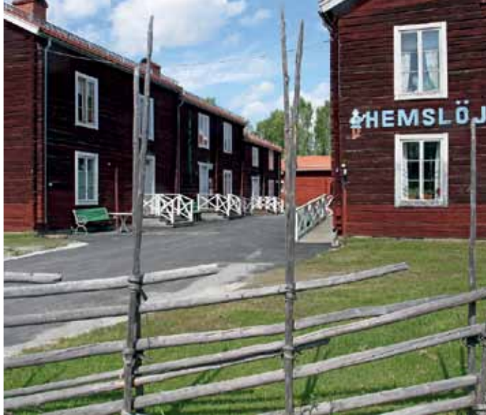
Åsele Hembygdsområde, Foto: Sylve Holmgren.

Mosjøen ligger i Vefsn kommun och är Helgelands äldsta stad och den näst äldsta i hela Nordland. Mosjøen är en kultur- och musikstad som arrangerar otaliga konserter och föreställningar under året. Sjøgataområdet i centrala Mosjøen är ett exempel på levande historia. De gamla husen från 1800-talet är fortfä-rande del av stadslivet och sätter färg på småstaden. På din upptäcksfärd i området hittar du många arkitektoniska pärlor och intressanta byggnader – ett skyddsvärt kulturarv. Mosjøen erbjuder många aktiviteter. Besök det nya badet på Kippermon, ta en promenad till Marsøra och se Sjøgata från havssidan eller gå upp till Mosåsen, nära och lättillgängligt. Vill du gå lite längre kan du ta en tur upp på Øyfjellet. Stall Ekvipasjen erbjuder ridtu-rer och på Mosjøen Camping du bowla. Under året genomförs flera stora arrangemang, bland annat Galleria Kunstfestival, Kippermocupen, de festliga Hanedagarna och Tiendebytte historiska marknad för att nämna några. ♦