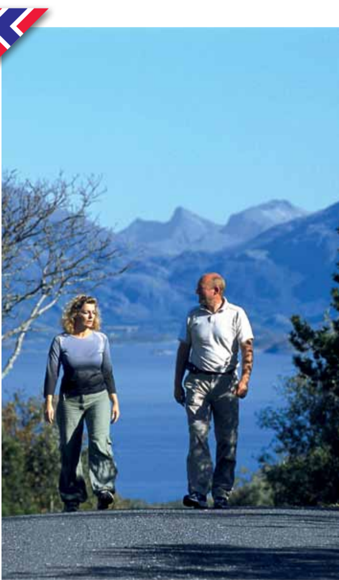
En tur upp mot Dennesfjellet.