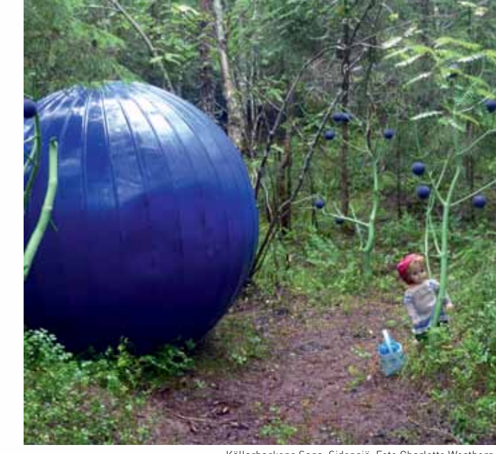
Källarbackens Saga, Sidensjö.