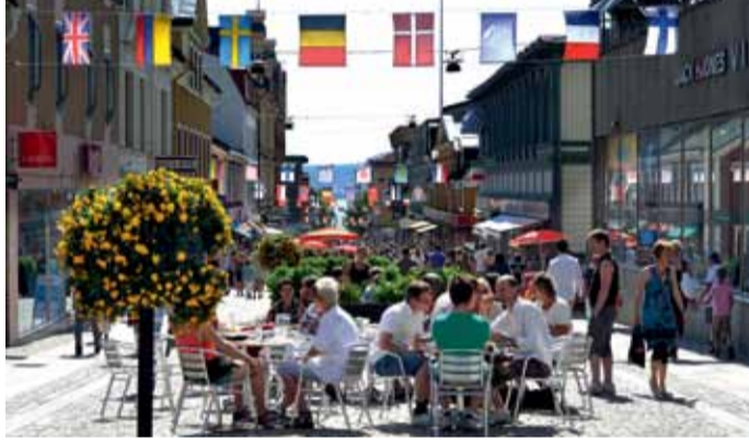
Örnsköldsviks centrum.

I Örnsköldsviks kommun finns 150 mil skoterleder och du kan hyra skoter bl a i Solberg och Bjästa. Friska Viljor Backhopp-ning erbjuder en fantastisk tävlings- och träningsanläggning som kan nyttjas både sommar och vinter. Tre skidanläggningar för utförsåkning finns i kommunen, Solbergsbacken, Bjästa-backen och Åsbacken. På Skytis finns en konstsnöanläggning för längdskidåkning. Modo Hockey, där många norska stjärnor spelat under åren, spelar sina SHL-matcher hemma i Fjällrä-ven Center. I februari varje år infaller Orrestaare Maarhna - en samisk marknad på Örnsköldsviks museum & konsthall.