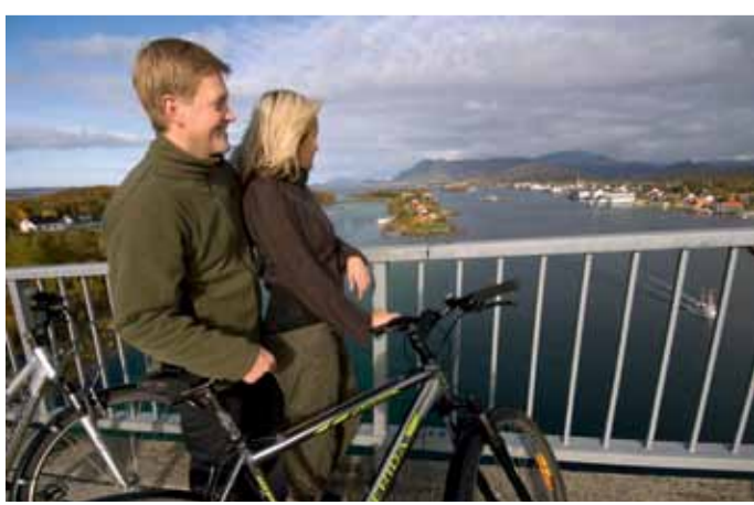
Utsikt från Brønnøybrua

Brønnøysund är en livlig småstad i Brønnøy kommun som önskar dig välkommen till den attraktiva gästhamnen, ett stort utbud av både handel och service samt ett rikt näringsliv i övrigt. Som centralort i regionen och knutpunkt för trafiken i södra Helgeland är Brønnøysund en mötesplats för lokabefolkning, turister och andra besökare. Hurtigruten lägger till dagligen, här finns direktflyg till både Oslo och Bergen, en helikopterbas för offshore-näringen och goda buss- och båtförbindelser. Torghatten, det spektakulära fjället med hålt tvärs igenom måste du bara besöka. Turen upp tar ca 30 minuter och utsikten är fantastisk. Ved foten av fjället ligger en utomhusbassäng med saltvatten. Du kan också vandra någon av de 10 markerade vandringslederna som leder till 10 fjälltoppar i området. Brøn-nøysund är också perfekt for cykelturer. Nordnorsk Opplevelse erbjuder turer med RIB-båt eller kajak om du vill ut på havet. ♦