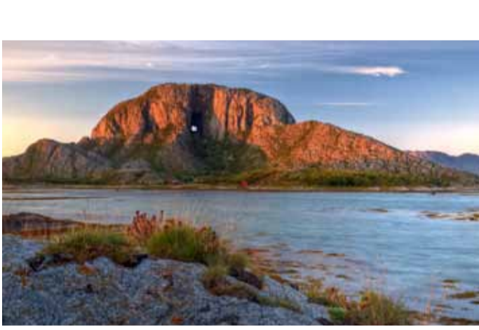
Torghatten i Brønnøy.

Sagavägen följer två av våra gamla vattenleder, Ångermanälven och Voymån. Genom er resa passerar ni platser som Meselefors, Rønnäs, Stalon och Grønssjøarna. Var och en med sin egen historia. Dikanäs är den lilla metropolen med ett fullspäckt