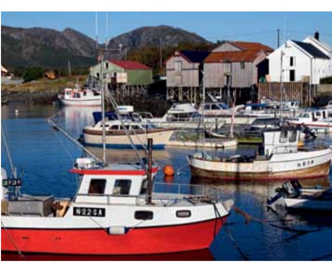
Viksjøens brygger i Sømna, Foto OrsøyaHaarberg.