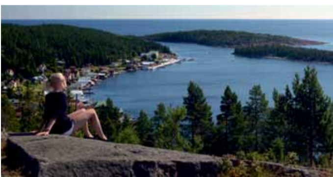
Utsikt över Ulvöhamn

Ulvön ligger i Örnsköldsviks skärgård, i hjärtat av Höga Kusten. Egentligen är Ulvöarna två öar – norra och södra Ulvön. Ulvöhamn ligger på norra ön, väl skyddad i Ulvösundet. Ulvön är kanske mest känd för surströmmingen, som tillverkats på ön i över hundra år. I den vackra skärgårdsmiljön finns restauranger,