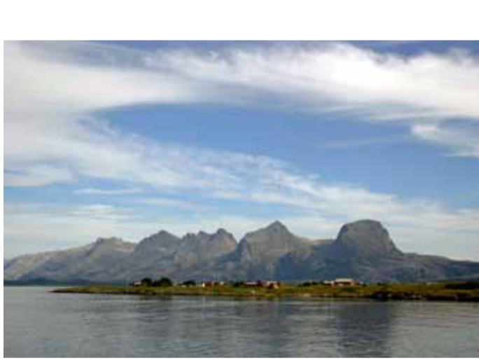
De syv søstre i Alstahaug, Foto: Sigrid Haarberg.

Spännande natur och kultur, och Norrlands största folkfest, Åsele Marknad, är något av det Åsele erbjuder besökaren. Mitt i Åsele samhälles centrum finns Åsele Hembygdsområde, en oas för kunskap och avkoppling, med bl.a. en av länets absolut förnämsta textilsamlingar med accessoarer. Alltid tredje helgen i juli genomgår Åsele en total omvandling, då kring 150 000 besökare under fyra mycket intensiva marknadsdagar samlas till Åsele Marknad, som utvecklets till att i dag vara Norrlands största folkfest. I kommunen finns också Bjørnlandet, Väst-erbottens enda nationalpark, och Stockholmsgata, en storslagen istidskanjon. För den fiskeintresserade finns många fina fiske-vatten att tillgå.