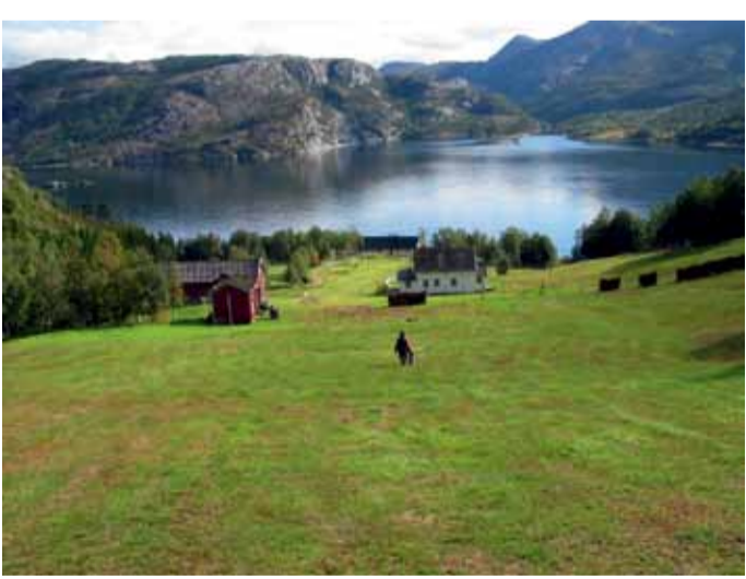
Benå Villmarkssenter.

Ökommunen Dønna har sedan har sedan folkvandringstiden varit ett betydande makt- och kulturcenter i Helgeland från till 1900-talets början. Ön har alltså en rik och stolt historia, naturen är storlagen och frodig och djurlivet är rikt, med bland annat en unik fågelfauna. Brevika är Dønnas finaste badstrand och ett idyllisk område för dina utflykter. Härifrån kan du också starta vandringen upp på toppen av Døn-namannen, en populär tur for den som önskar sig en liten utma-ning på fjället. Øya Løkta ligger på nordostsidan av Dønna och är ett perfekt mål för cykelturer. Till Dønna kommer du med färja från Sandnessjøen, eller över Åkviksundsbron som förbinder Herøy och Dønna. ♦